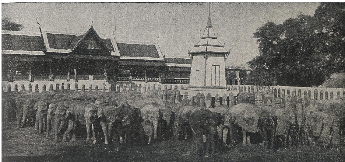
Slavnostní místo chytací v Aynthii

býti zadržena. Zpravidla však se povede obklíčené stádo zahrnati do ohrady a přes neklid a příležitostné pokusy o osvobození jsou zvířata chycena. Je-li po prvním chaosu, jsou poslání krotcí sloni se svými vůdci a vazači do khedasu, ti se zmocňují jednoho slona po druhém, poutají je a odvádějí do okolního lesa, kde je přivazují ke stromům. Tím jest chytání ukončeno a počne se s ochočováním. Toto chytání slonů jest pořádáno státem na Ceyloně i v Přední a Zadní Indii a jest považováno za podnik tak málo nebezpečný, že jsou budovány vždy tribuny pro diváky, pro anglické koloniální úřady a jiné vynikající hosty s jejich dámami. Nynější král anglický s královnou mohl sledovati r. 1906 tento způsob lovu na cestičkách k tomu účelu zřízených; bylo to za jeho návštěvy u mysorského maharadži; konečnou část provazu, za který byly uvázané padací dveře, vlastnoručně přetřal. V Siamu, v zemi „bílého slona“ jsou tyto lovy národními slavnostmi a na místa lovů proudí desetitisícové zástupy; král siamský je pořádá rád tehdy, má-li návštěvou vysoké evropské hodnostáře. V Siamu však jsou divocí sloni sháněni po několika stech z dalekého okrsku, což trvá přirozeně mnoho dní i neděl; stáda jsou zahrnata na určité, vždy užívané místo, siamsky zvané panieh. V Aynthii, kde jest královský pavilon a kryté tribuny k sezení; sem jsou pak diváci dopravováni k slavnosti zvláštním vlakem z Bangkoku.“